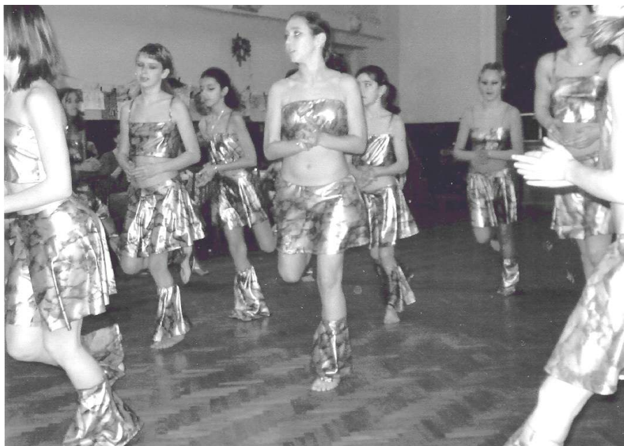
Ilustrace 1 Snímek z předtančení žáků ZŠ na plesu SRPŠ